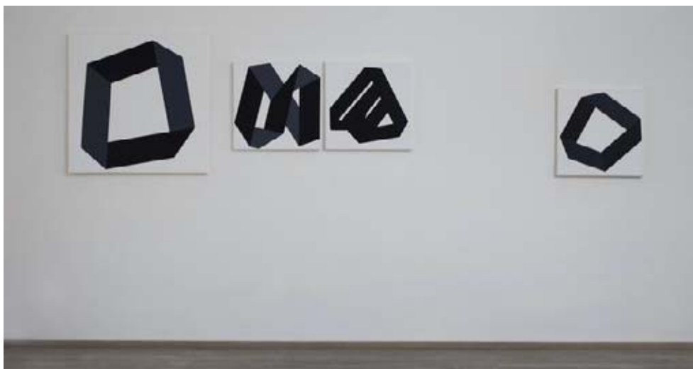
« Pliage XII », acrylique sur toile, 80 x 80 cm, 2018, Prix Public 8.000 euros, « Pliages V, VI, XV », acrylique sur toile, 50 x 50 cm, 2018, 3.500 euros.

► Ode Bertrand. La discrète , Art'Loft Lee-Bauwens Gallery, jusqu'au 26 mai, du jeudi au samedi de 14 à 18 h ou sur rendez-vous, brunch de finissage de 13 à 18 h, 36 rue du Charme, 1190 Bruxelles, 0475-411.963, www.artloft.eu